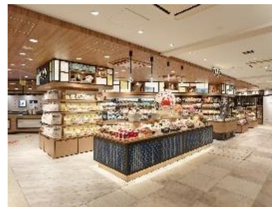
コーナー展開イメージ

また、空き家などを活用した古民家再生を起点とした宿泊事業の展開など新たな地域事業創造などの検討も行っていきます。