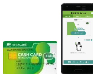
ゆうちょ銀行とモバイル Suica の連携イメージ