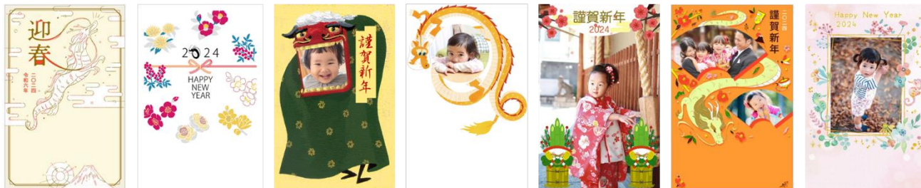
※画像はデザインテンプレートの一部

また、喪中欠礼や寒中見舞いでご利用いただける「喪中・寒中見舞い」デザインもご用意しています。