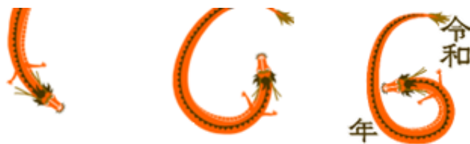
※画像は「動くスタンプ」の一例

「手書き/打ち文字メッセージ」はもちろんのこと、「動くエフェクト付きテンプレート」「動画挿入」「ボイス挿入」「動くスタンプ挿入」など、自由にカスタマイズしながらデジタルの特性を活かした動きのあるデザインを作成することが可能です。