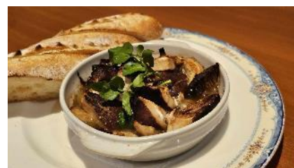
『菜宴』月ヶ瀬特産品を使った料理 「シイタケのアヒージョ」