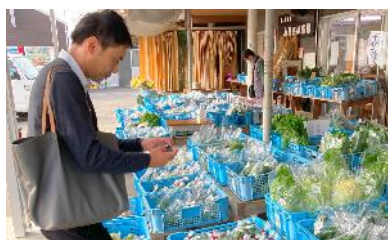
受注と特産品ピックアップ