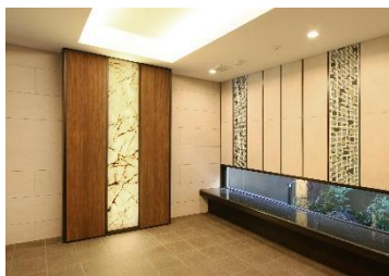
住宅エントランス