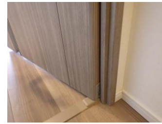
指はさみ防止扉の開き戸