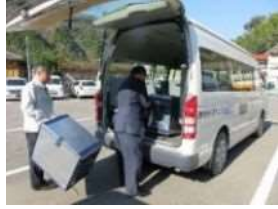
小川へ運ぶ荷物を積載