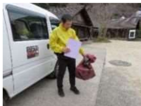
地区の郵便ポストから収集 した郵便物を郵袋に収納