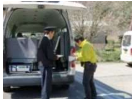
村の委託配達員が 荷物を受取り