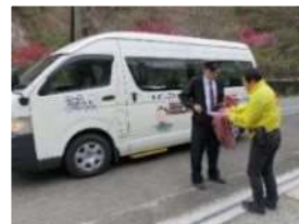
郵袋を村営バスに積載