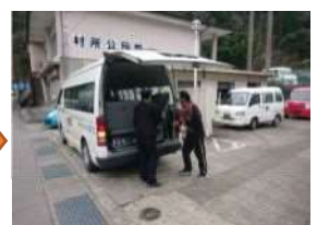
郵便局員が郵袋を受取り、 輸送完了