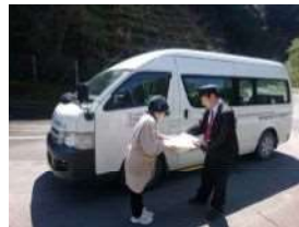
村営バスにヤマト運輸 の荷物を積載