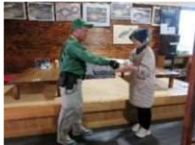
ヤマト運輸の荷物を 受取り、一時保管