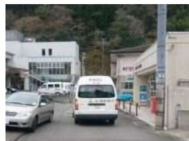
村営バスが郵便局前に 到着