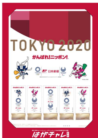
(オリジナル切手 84 円×5 枚および台紙表)