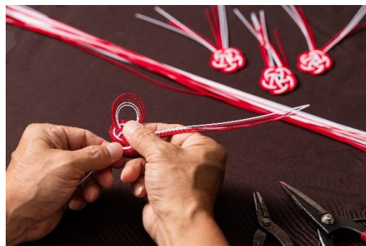
水引制作の様子（イメージ）