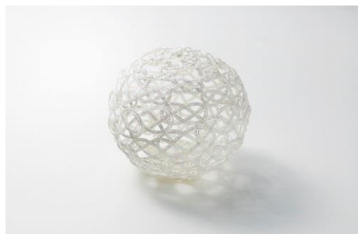
クリスマスツリーの演出に使用する水引（イメージ）