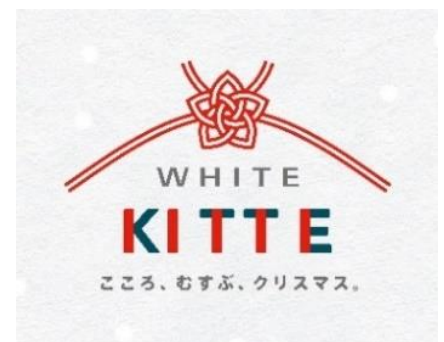
メインビジュアル

まもなく迎える 2020 年に向けて、世界と日本、人と人、心と心を「むすぶ」というKITTEの想いを、一つひとつ、職人の手によって編まれた日本の伝統工芸“水引”を使った新しいクリスマスツリーで表現します。