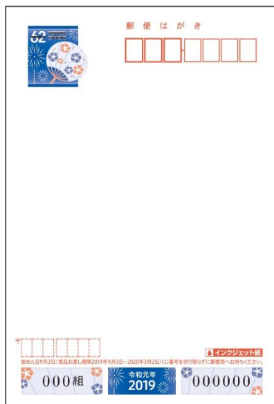
インクジェット紙