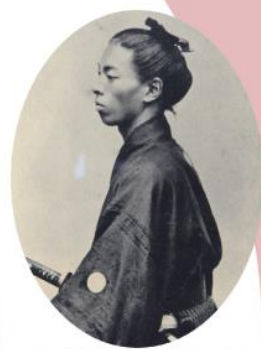
佐川町出身の元宮内大臣 ○田中光顕