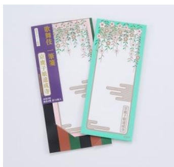
包装イメージ／商品本体

演目の衣裳をモチーフにした一筆箋。水色 8 枚、桃色 8 枚の計 16 枚セット。(サイズ：約 19×8cm)