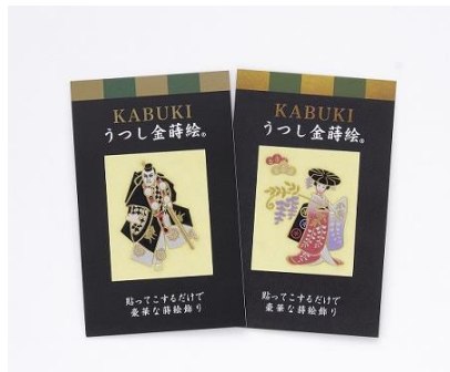
左: 勸進帳／右: 藤娘

歌舞伎演目(勸進帳、藤娘)をデザインした金蒔絵風の写し絵シール。(サイズ: 約 4.5×3.5cm)