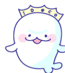
iDeCo 普及推進キャラクター 「イデコちゃん」