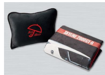
スカイライン 2000GT-R (KPGC110) 復刻デザイン