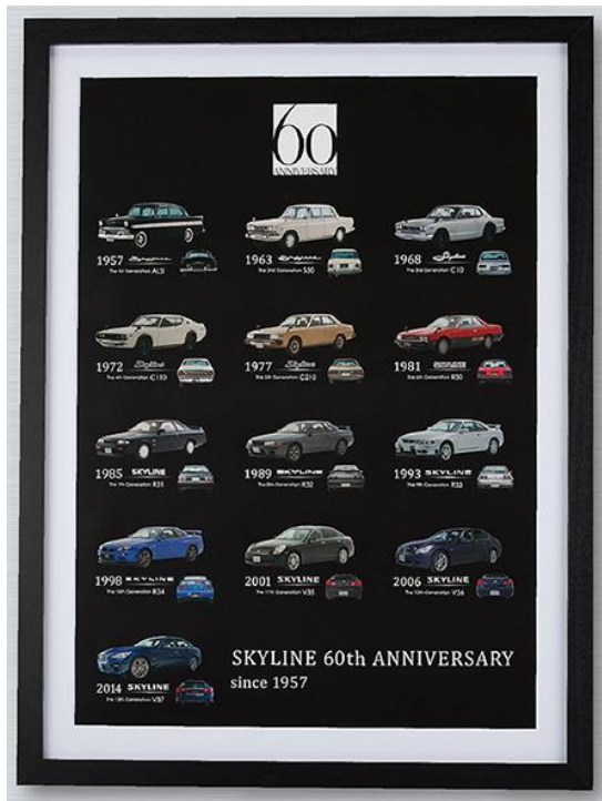
スカイライン 60 周年記念デザイン

20 ミクロンの極小なドットで細部まで表現可能な高精細印刷で仕上げたポスターです。マット付きの日本製の額に収めることで、ご自宅はもちろん、オフィスや店舗に飾っていただいても上質な空間を演出します。