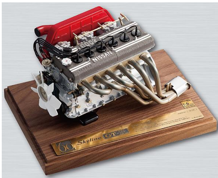
エンジンモデル（本体）

部品製造、組み立て、塗装全てをジャパンメイドにこだわり、一機一機ハンドメイドで製作される、日下エンジニアリング株式会社製作の「1/6 スケールエンジンモデル GT-R S20」です。郵便局限定仕様として、一部パーツのディテールアップを行い、さらに、キャブレター&クリーナーボックス部分のコンバートを可能にしました。また、コンバートしたキャブレター&クリーナーボックスを飾る専用の台座付きです。生産数 60 個の数量限定商品となります。