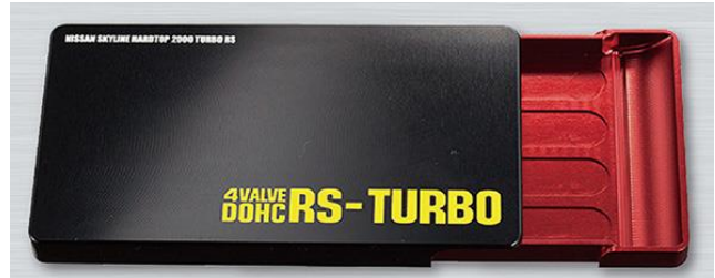
スカイライン ハードトップ 2000 ターボ RS モデル