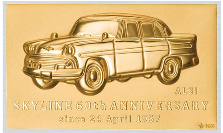
純金プレート（本体）