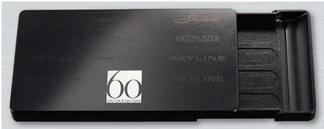
スカイライン 60 周年記念モデル

航空・宇宙産業にも採用されている「A2017」と呼ばれるジュラルミン無垢材を使用し、直径 3mm の極小ベアリングを 4 個内蔵することにより、滑らかな開閉を実現。さらに、心地よい開閉感を得られるように、本体内部にスプリングと銅球を使用したラッチ機構を採用しました。有限会社ギルドデザインが、削り出しから組み立て・パッケージの箱に至るまで徹底してジャパンメイドかつ高品質にこだわりました。