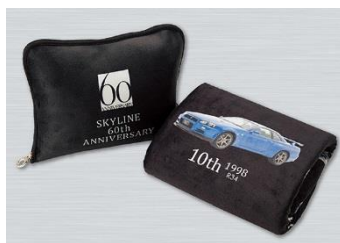
スカイライン 60 周年記念デザイン