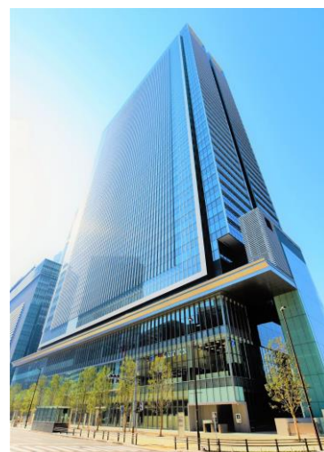
JP TOWER NAGOYA