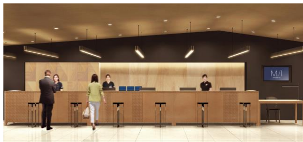
名駅サテライトクリニック（イメージ）

さらに、女性のお客さまには女性専用の診療エリアを設け、女性のためのスタッフによるきめ細かな医療サービスと心温まる空間をご用意するほか、海外からのお客さまのニーズにお応えする一端を担うため、医療ツーリズムとしての健診、各種人間ドック、アンチエイジングドックを提供するなど、総合健診センターを通じて皆さまの健康と医療の発展への貢献に取り組みます。