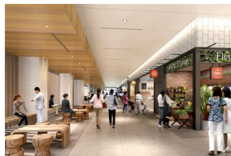
KITTE名古屋1階（イメージ）

オフィスワーカーにとっての利便性を意識しながらも、バスターミナル乗車口の店舗エリアとして、家路につく人たちのつかの間の休憩時間に対応し、ちょっとした自分へのご褒美やお土産等で気分を盛り上げてくれる場所となります。