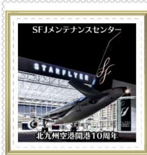
北九州空港開港10周年