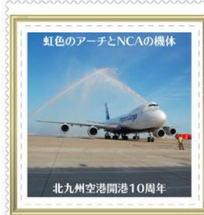
北九州空港開港10周年