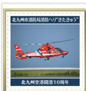
北九州空港開港10周年