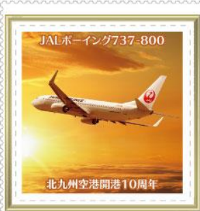
北九州空港開港10周年