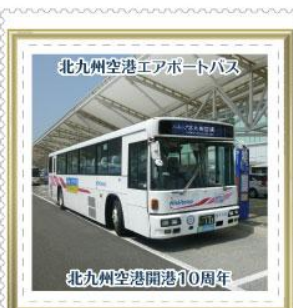
北九州空港開港10周年