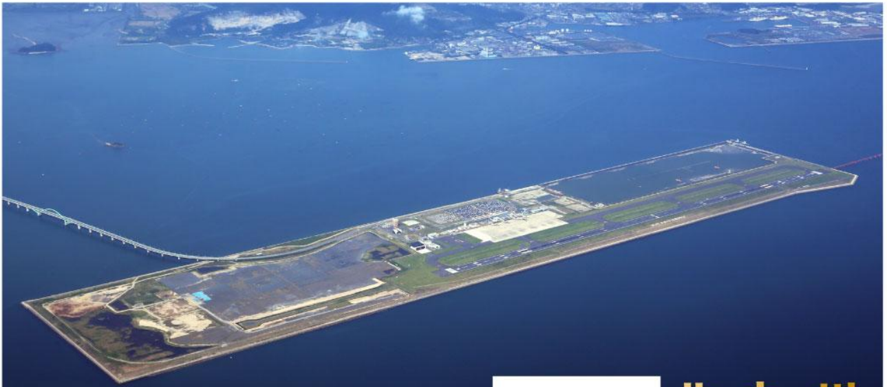
周防灘上空より北九州空港全景を望む