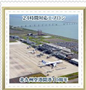
北九州空港開港10周年