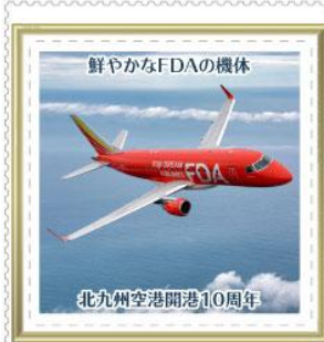
北九州空港開港10周年