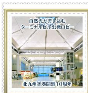
北九州空港開港10周年