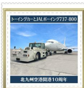
北九州空港開港10周年