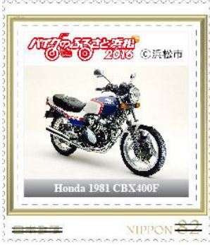
Honda 1981 CBX400F