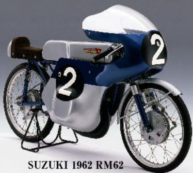
SUZUKI 1962 RM62