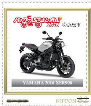
YAMAHA 2016 XSR900