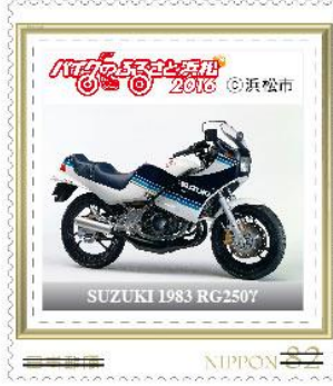
SUZUKI 1983 RG250Y