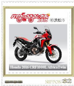
Honda 2016 CRF1000L AfricaTwin