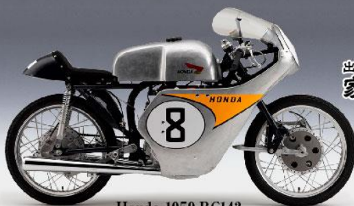
Honda 1959 RC142