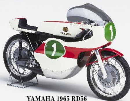
YAMAHA 1965 RD56