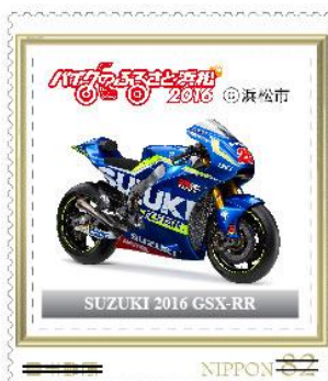
SUZUKI 2016 GSX-RR