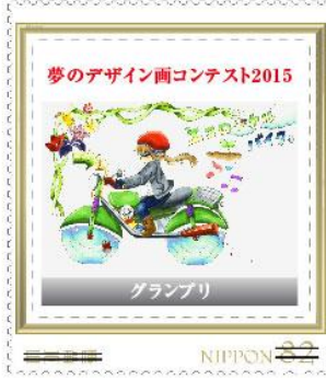
夢のデザイン画コンテスト2015