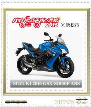
SUZUKI 2016 GSX-S1000F ABS