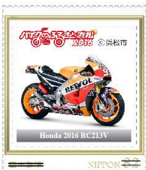
Honda 2016 RC213V