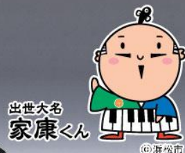
出世大名 家康くん