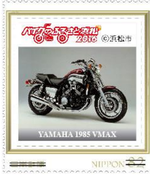
YAMAHA 1985 VMAX