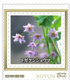
トガクシショウマ