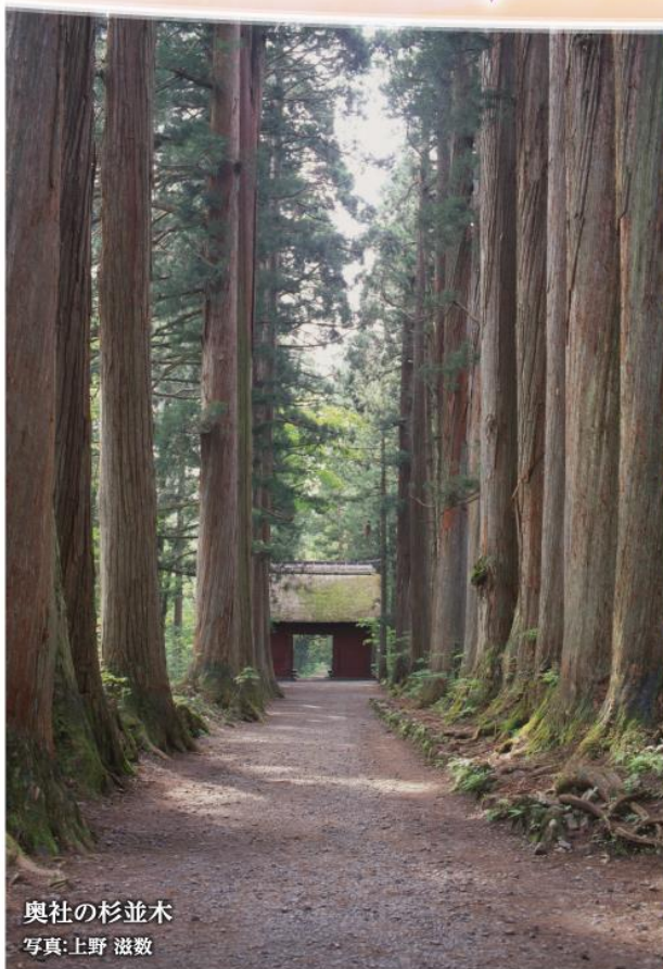
奥社の杉並木