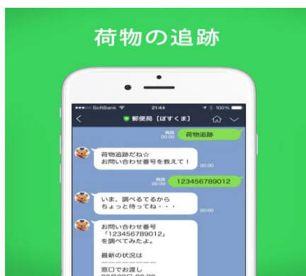
「荷物追跡」「お問い合わせ番号」をトークに入力すると、配達状況を、すぐにご確認いただけます。