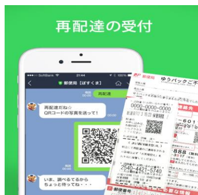
ご不在連絡票の QR コードを撮影してトークに送ると、専用のサイトにリンクして手続きができます。