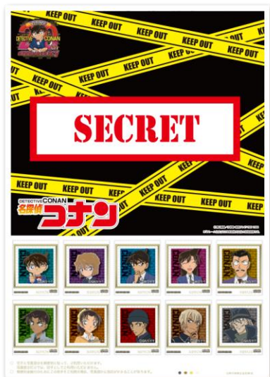
フレーム切手 (52円切手(シールタイプ) × 10枚)