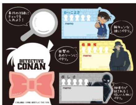
ふせんセット (5種類 × 15枚)