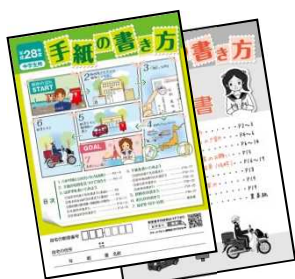
●中学1・2・3年生共通