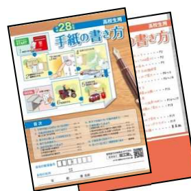
●高校1・2・3年生共通