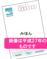
●かもめ〜る (夏のおたより郵便はがき)