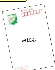
●くぼみ入りはがき (通年)