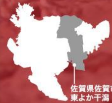
佐賀県佐賀市 東よか干潟