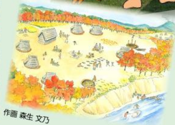
作画 森生 文乃

下野谷遺跡は、東京都西東京市東伏見6丁目周辺に広がる、 今から4~5千年前の南関東最大級の縄文時代中期の集落です。 家や倉庫が、墓域のある広場を囲む「環状集落」と呼ばれる縄文 時代の典型的なムラが、市街地の足下に眠っています。 地域の拠点となる大集落は未来に残すべき貴重な文化遺産です。