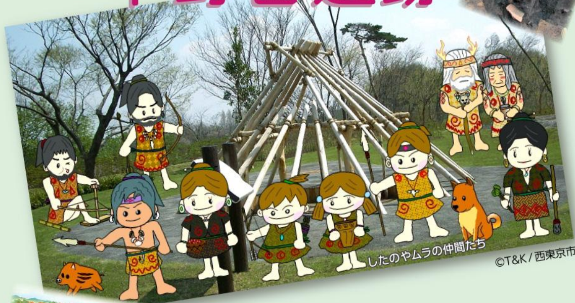
したのやムラの仲間たち