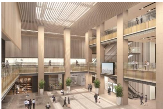
1Fアトリウム（イメージ）