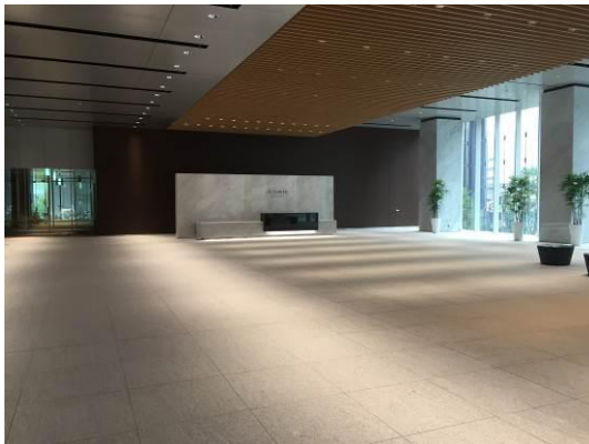
オフィスエントランス

また、高断熱外壁（Low-E ペアガラス）や自然換気システムといった環境負荷を軽減する外装計画に加え、省エネ機器の設置や水処理システムの導入、ステップガーデンの緑化、さらに駐車場棟における太陽光発電パネルの設置、風力発電、屋上緑化・壁面緑化など、次世代のオフィスに求められるさまざまな視点からのきめ細やかな環境対策を行います。