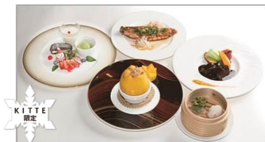
クリスマス限定ディナーコース／10,000 円