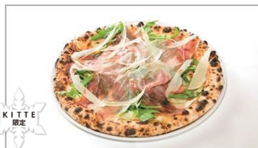
パルマの生ハムとルーコラ、パルミジャーノの ピアンカピッツァ／2,138 円

名物フカヒレとパパイアのスープや、特大エビ、国産牛ホホ肉など、料理長厳選の食材をぜいたくに味わえるクリスマスシーズン限定のお得なコース全 8 品。東京駅舎が見える夜景が楽しめる席も有。限りがあるので予約は早めに。販売期間：12／23～12／27 ※ディナー限定、要予約。