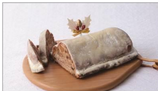
シュトーレン／大 3,888 円 小 1,080 円

スポンジケーキ、フランボワーズムース、クッキークリームの3層仕立て。絶妙な甘酸っぱさとかわいらしいピンク色、フランボワーズのやさしい香りに心が弾む一品です。ベリー・ゼリーもアクセントに。※サイズ／4号 販売期間：12／19～12／25 ※11／1～12／18 まで予約可。(お渡しは 12／19～12／25)