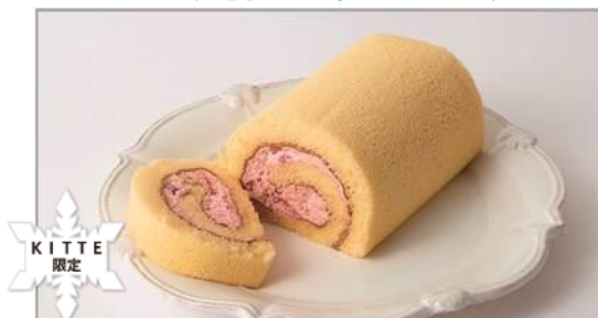
こしひかり米粉を使った苺のロール／1,080 円