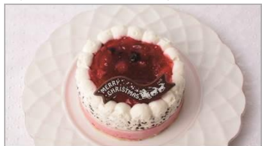
牧場のベリームースケーキ／2,000 円

スペイン産バレンシアアーモンドを使用した風味豊かな生地にクランチ入りのミルクチョコをコーティング。ドライフルーツをのせて Xmas リース風に仕上げたかわいいケーキです。※サイズ／直径 11cm x 高さ 5cm 販売期間：12／1～12／25