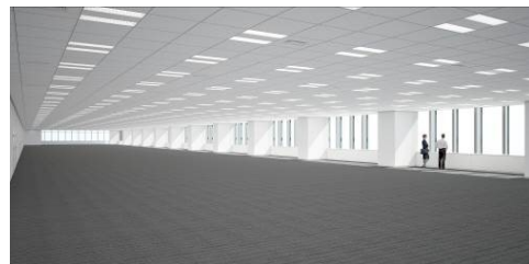
「オフィスフロア」(イメージ)