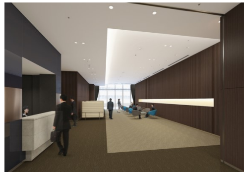
「JPタワー名古屋 ホール&カンファレンス」 (ロビーイメージ)