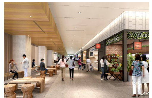
1F フLOOR (イメージ)

出店店舗については、コンセプトである『「名古屋を」伝える、「名古屋に」伝える』を基に、普段使いのしやすいオープン型飲食店や特別な時間を演出する大型飲食店、トレンド感のあるカフェ・ダイニングなどバリエーション豊かな飲食店舗のほか、つい買って帰りたくなるご褒美やお土産などが集まる食物販、こだわりの物販やサービスの店舗などが集まります。