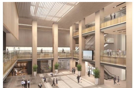
1Fアトリウム（イメージ）