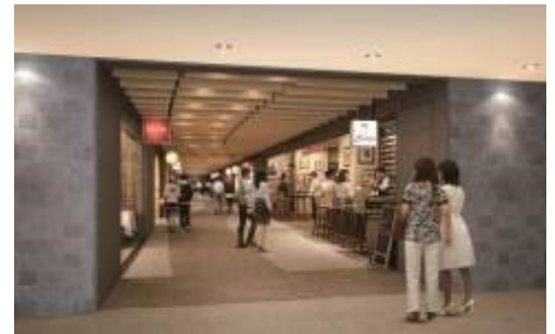
B1 フLOOR (イメージ)

中部圏のビジネスの中心地であり、人や文化が集結する名駅エリアにおいて、「JPタワー名古屋」および周辺オフィスで働く都市感性を持つ就業者と、大人の感覚や感性を持ち、駅、バス、駐車場を経由して集まる、好奇心旺盛なエリア来訪者をターゲットとします。