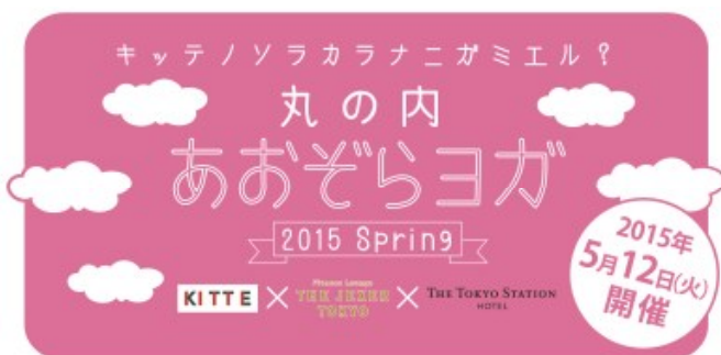
「丸の内あおぞらヨガ 2015 Spring」

「丸の内あおぞらヨガ」では、2015年秋頃に次回開催を予定するなど、今後の定期的な開催を検討しており、丸の内エリアでお働くアクティブな女性に朝活の一環として、“心身のウェルネス”の機会を提供してまいります。