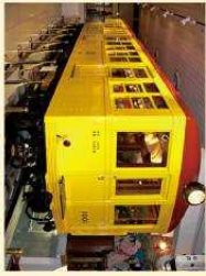
地下鉄博物館の1001号車

第一号車である「1001号車」は、 貴重な近代化遺産として、地下鉄博 物館(東西線葛西駅下車)に保存・ 展示されています。