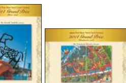
<受賞記念ポストカード>