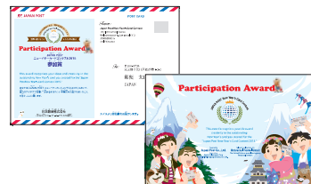
<キッズ部門参加賞>