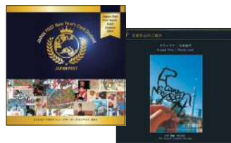
<記念フォトブック>