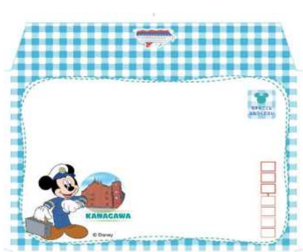
封筒 3 枚