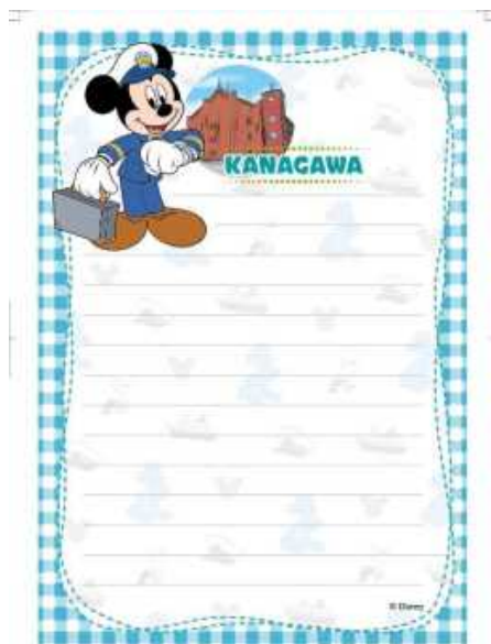
便箋 6 枚