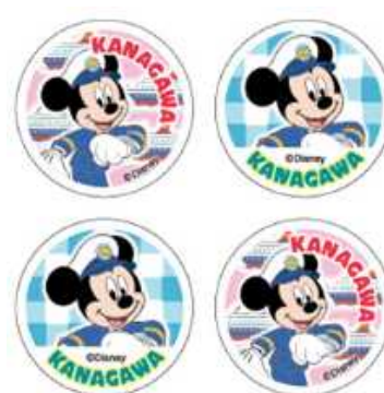
シール 1 シート