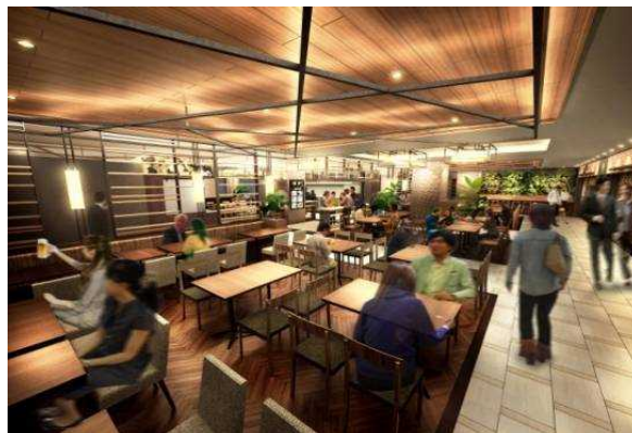
3 階「バルテラス」客席イメージ