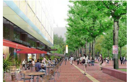
1階「オープンテラス」イメージ

札幌市北3条広場側に面した1階部分には、オープンカフェやオープンバルを配置し、広場と一体となった賑わいを創出します。季節の良い時期には、オープンテラスでイチョウ並木の木漏れ日と爽やかな風を感じながら、豊かな時間を過ごせる心地の良い空間を提供します。