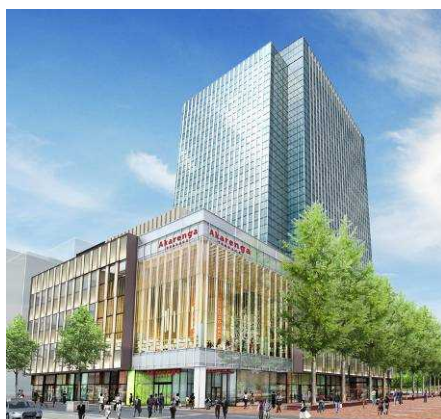
「赤れんが テラス (Akarenga TERRACE)」外観イメージ