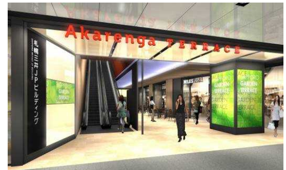
地下1階「エントランス」イメージ

本商業施設は平日1日約8万人が通行する札幌駅前地下歩行空間「チ・カ・ホ」からダイレクトアクセス可能な場所に位置しています。こうした立地特性を生かし、明るく開放的な環境を地下エントランスに整備します。光天井やデジタルサイネージなどを設置するほか、テーブルやイスなどを配したテラスを設け、憩いの空間を創出します。また、地下エントランスは、地上へのスムーズなアプローチとしてもご利用いただけるため、エリア全体の回遊性を高めます。