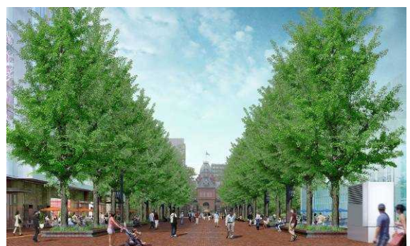
「札幌市北3条広場」完成イメージ