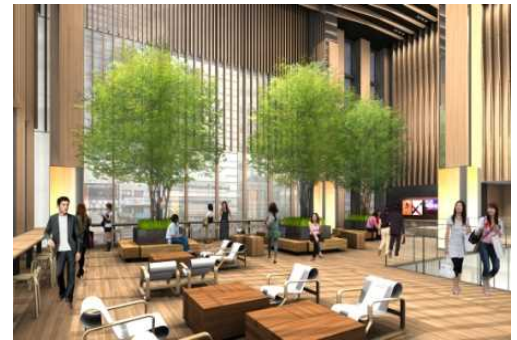
2階「アトリウムテラス」イメージ

商業内装デザイナーには「東京ミッドタウン」「三井アウトレットパーク札幌北広島」等の実績があるスタジオタクシミズの清水卓（シミズタク）氏を起用。このエリアの歴史や美しい風景にあった「煉瓦」や「木」といった自然素材を多く取り入れた自然感ある内装デザインとしました。居心地の良い都会のオアシスとして、夏は快適に、冬は暖かみを感じることできる空間づくりとしています。