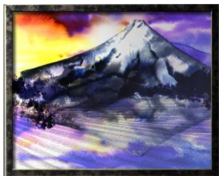
カシオアートの作品例「富士」 今回発売するものではありません

今回、カシオでは日本郵便の協力の下、郵便切手のデザインを採用した商品の展開を開始します。第一弾として、7月23日のふみの日切手のデザインを題材にした商品を、カシオ公式オンラインショッピングサイト「e-casio」及びグループ会社直営店で発売します。尚、取扱い店については、順次拡大する予定です。