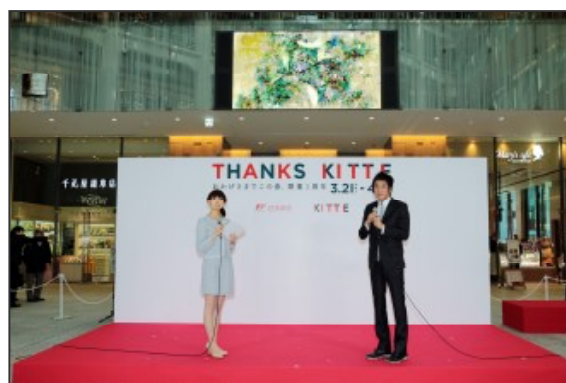
<KITTE1周年セレモニーの様子>