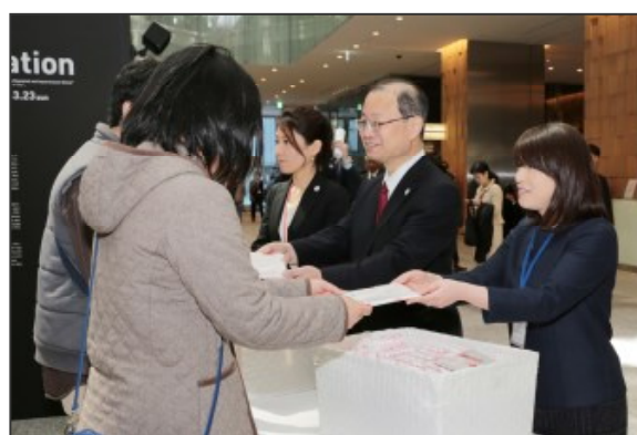
<KITTE1周年記念品配布の様子>