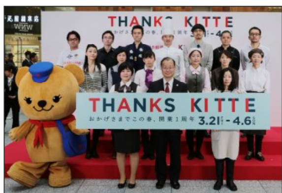
<KITTE1周年セレモニーの様子>