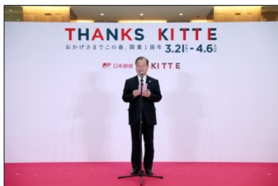
<KITTE1周年セレモニーの様子>