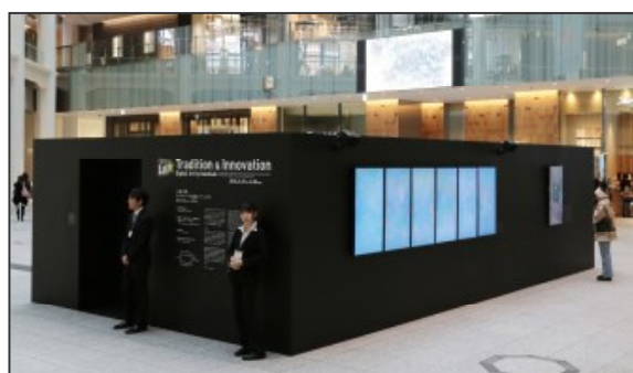
<デジタルアート展の様子>