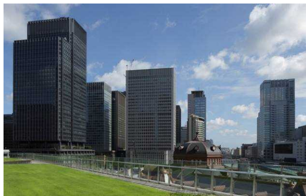
「KITTEガーデン」から望む丸の内の景色