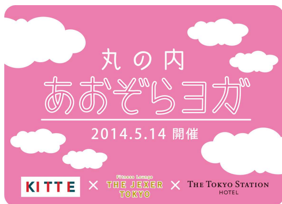
「丸の内あおぞらヨガ」

「丸の内あおぞらヨガ」のメイン会場は、東京駅赤レンガ駅舎から近い商業施設KITTE。屋上庭園「KITTEガーデン」で行う初めてのイベントとなります。丸の内の高層ビルや赤レンガ駅舎を目の前に、開放感溢れる場所でプロのインストラクターによるヨガレッスンをお楽しみいただけます。その他、東京ステーションホテル内の会員制フィットネスラウンジ「Fitness Lounge THE JEXER TOKYO」の温浴施設利用、KITTE内の3店舗と東京ステーションホテルの「ロビーラウンジ」から選べる朝食、ヨガマットレンタル、プレゼントなど、充実した特典が付いています。いつもの通勤スタイルで、お仕事前に手軽にご参加いただけます。