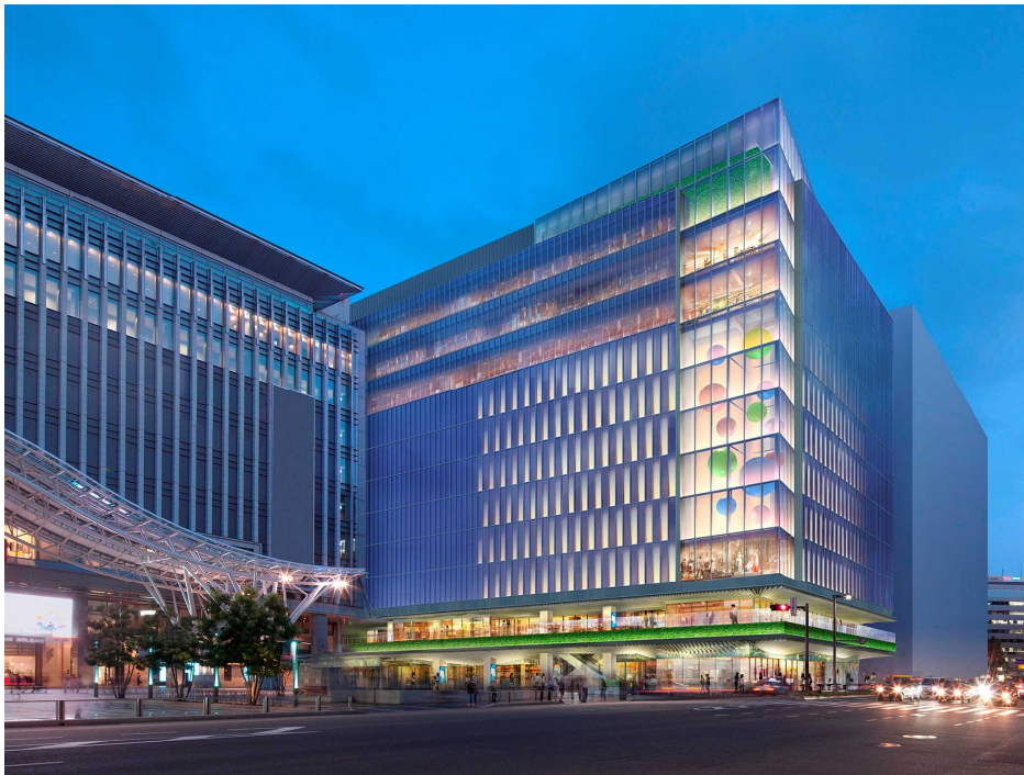
建物外観イメージ（夜景）