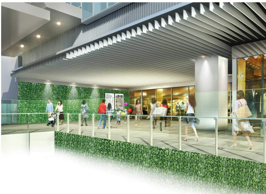
2階連続デッキイメージ