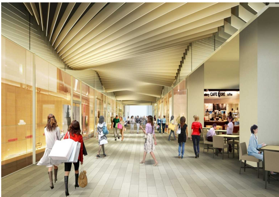
1階貫通道路イメージ