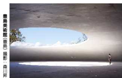
豊島美術館(豊島)