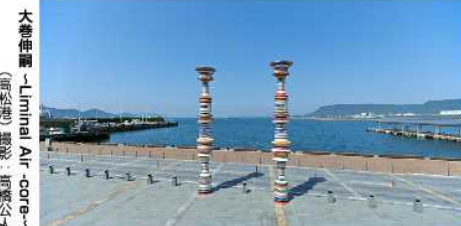
大巻伸嗣/Liminal Air-core (高松港)