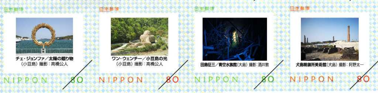
チェ・ジョンファ/太陽の贈り物 (小豆島)