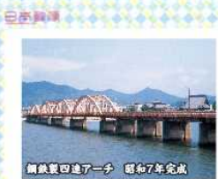
鋼鉄製田通ア一子 昭和7年完成