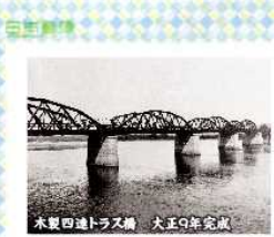
水夏田通トラス橋 大正9年完成