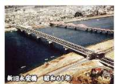
新田永安橋 昭和61年