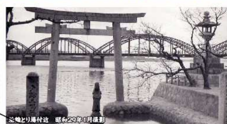
芝橋と日蓮村邊 昭和29年1月撮影