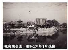
観音院全景 昭和29年1月撮影