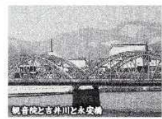
観音院と吉井川と永安橋