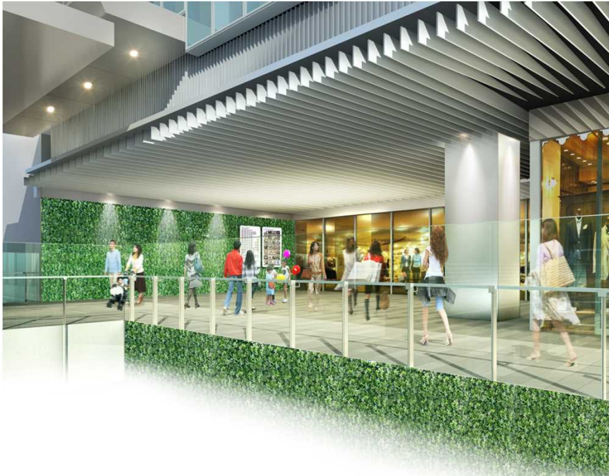
2階連続デッキイメージ