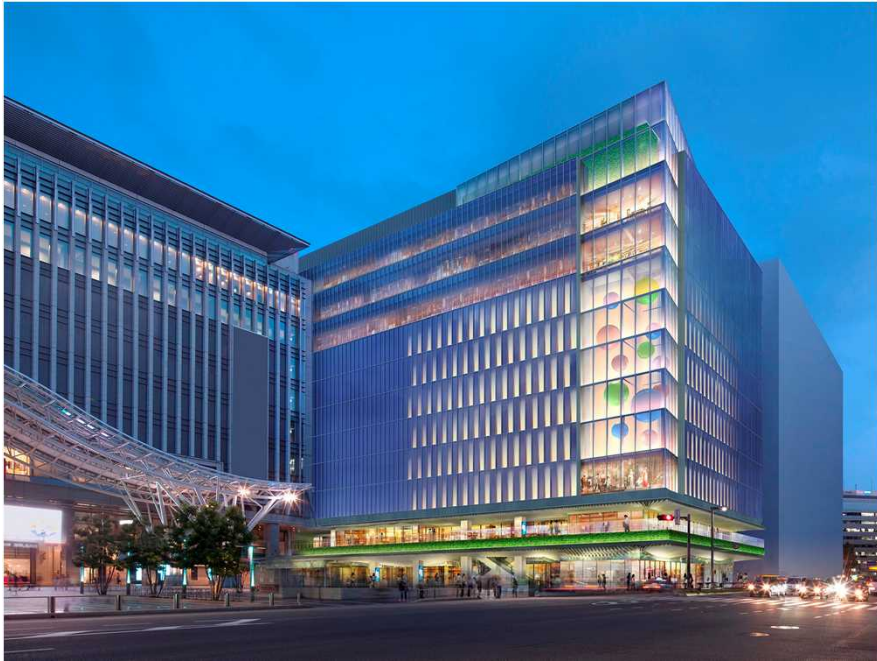
建物外観イメージ（夜景）