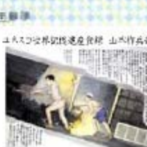
ユネスコ世界記憶遺産登録 山本竹島