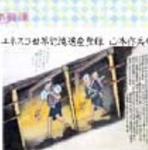
ユネスコ世界記憶遺産登録 山本竹島