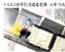
ユネスコ世界記憶遺産登録 山本竹島