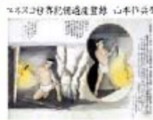
ユネスコ世界記憶遺産登録 山本竹島