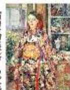
「可憐な娘だ」と片一の女が叫ぶ