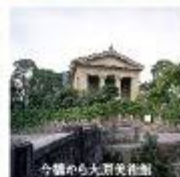
今後は大買客向け