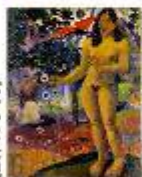
大光のわしき大船