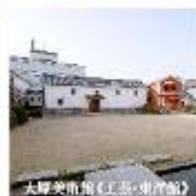
大塚英南繪《王宮·東洋館》