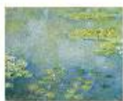
クロード・モネ《睡蓮》