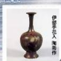
伊豆里花入 陶秀作