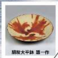
胡散大平鉢 雄一作