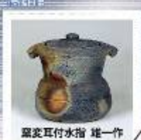
翠雲耳付水指 雄一作