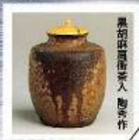
黒胡麻油燻茶入 陶秀作