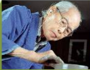
人間国宝 山本 陶秀 1906～1994