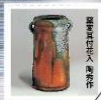
翠雲耳付水指 陶秀作