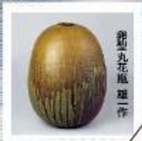
卵形丸花瓶 雄一作