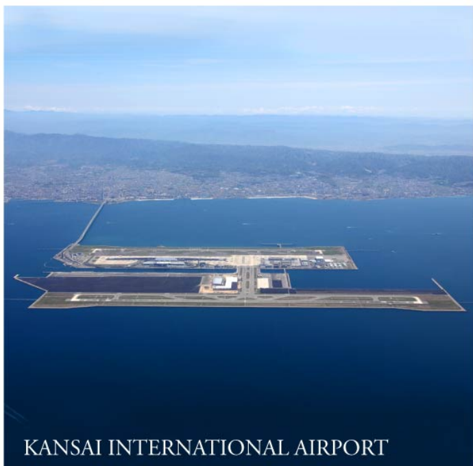
KANSAI INTERNATIONAL AIRPORT