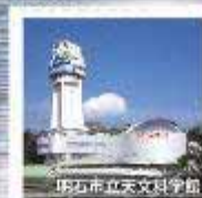
明石市立天文科学館