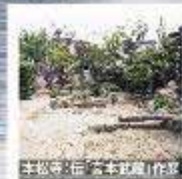
本館等(伝本館蔵)作品