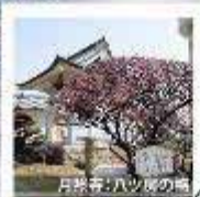
月形等(ハツ風の館)