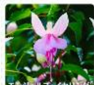
エンジェルス・イヤリング ®