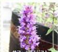
サマー・アメジスト