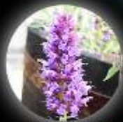
サマー・アメジスト