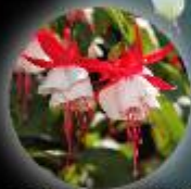
エンジェルス・イヤリング ®