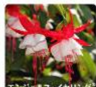
エンジェルス・イヤリング ®