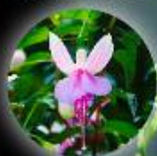
エンジェルス・イヤリング ®