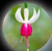
エンジェルス・イヤリング ®