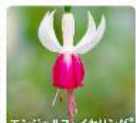
エンジェルス・イヤリング ®