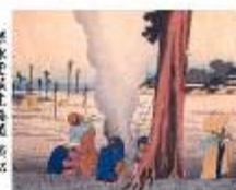
保永堂版東海道舟松