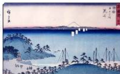
歌川広重 鎌倉東海道舟二葉舟