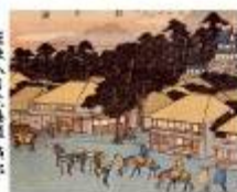
保永堂版東海道舟松