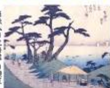
保永堂版東海道舟松