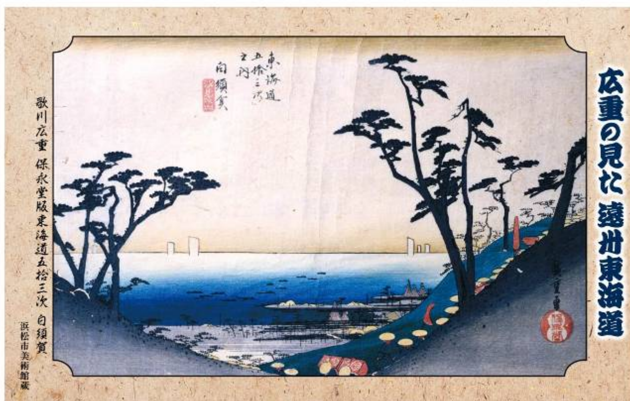
歌川広重 鎌倉東海道舟はま松