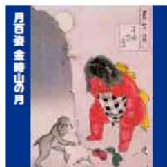
月白姿 金時山の月