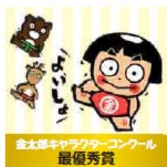
金太郎キャラクターコンクール 最優秀賞