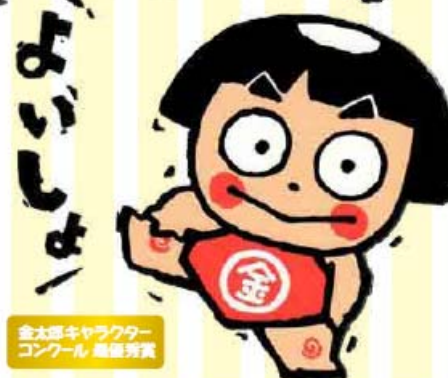
金太郎キャラクター コンクール 最優秀賞