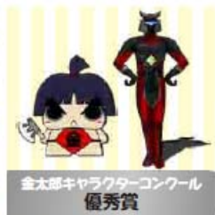
金太郎キャラクターコンクール 優秀賞