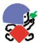
市制施行20周年記念 金太郎シンボルマーク