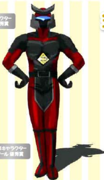
金太郎キャラクター コンクール 優秀賞