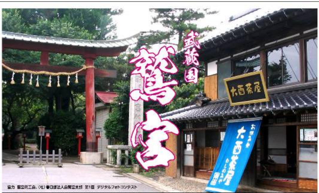
協力 鶴家株式会社（社）春日部法人会鶴家支社 第1回 デジタルフォトコンテスト

【作品名】 ①「諏訪明神神社」久保田まこと資料館提供/②「おぼろどらり?」中島敦 提供/③「燃える灯火」hayayan/④「花道でふりまき」モント/⑤「秋の彩り」豊村 志穂 ⑥「初夏の鶴家総合支社」遠坂 友和/⑦「鶴ヶ谷千賀神社」遠坂 友和/⑧「鶴ヶ谷の燈」あけむら/⑨「元日の夜明け」あけむら/⑩「サクラ咲く神社」yoko yskonem