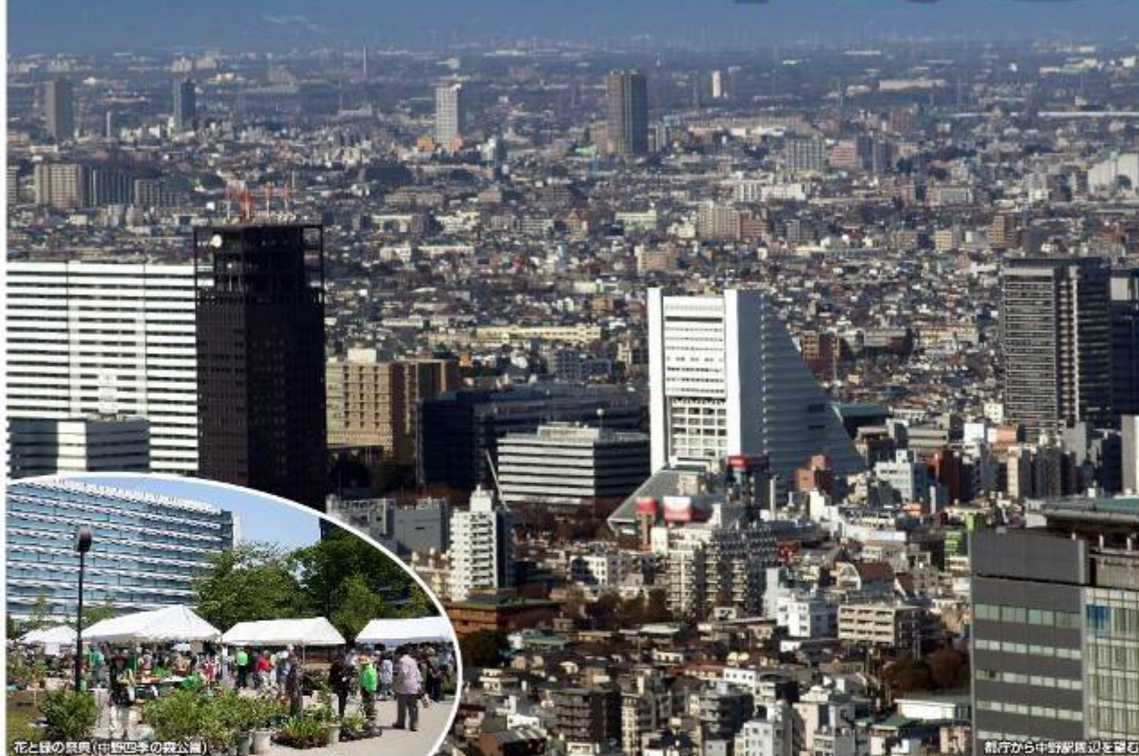
花と緑の祭典(中野四季の森公園)