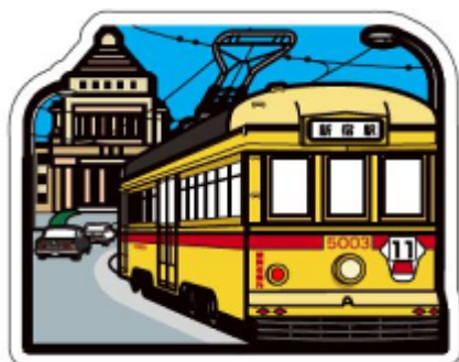
1968（昭和 43）年頃の都電と国会議事堂 フォルムカード