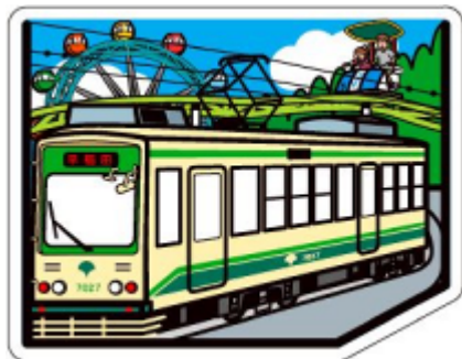
現在の都電とあらかわ遊園 フォルムカード