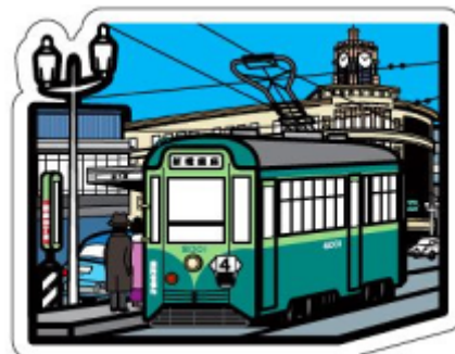
1957（昭和 32）年頃の都電と銀座四丁目 フォルムカード