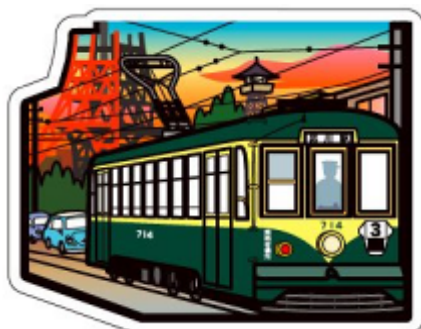
1958（昭和 33）年頃の都電と東京タワー フォルムカード