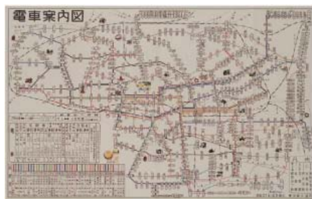
都電復刻路線図（昭和 37 年 東京都交通局発行）