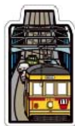
1962（昭和 37）年頃の都電と勝鬨橋 ミニカード