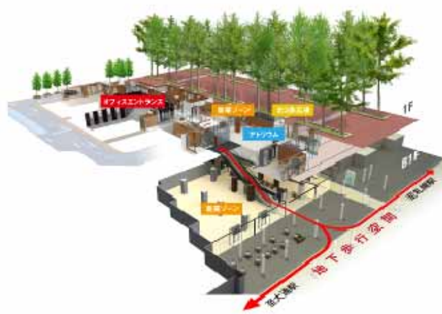
地下歩行空間からのアプローチ