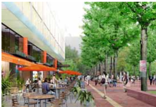
建物低層部（広場側）イメージ

「（仮称）北3条広場」に面した商業店舗の配置や、地下と地上の往来に配慮したスムーズなアプローチなど、地上部の新たな賑わい創りにも貢献。