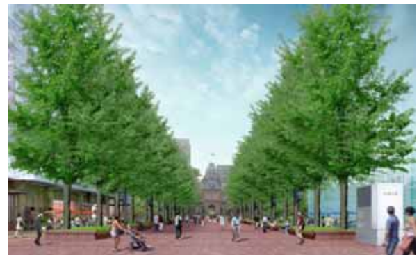
（仮称）北3条広場全景イメージ