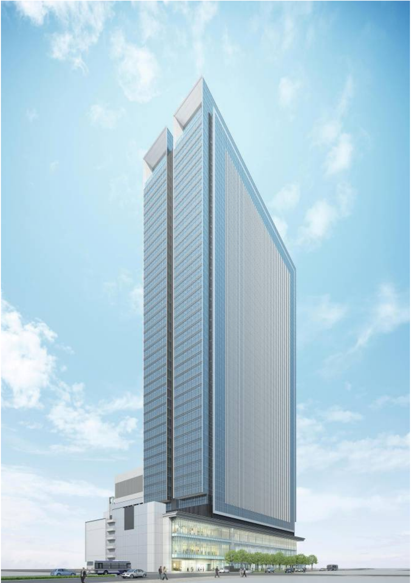
完成予想イメージ図（名駅通からの外観）