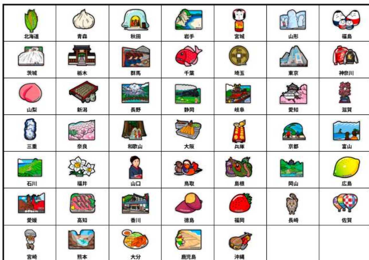
写真：今回発売する全国47都道府県のイラスト47種類のイメージ

第4弾の47種類は、それぞれ横タイプ（概ねW170mm×H133mm）または縦タイプ（概ねW100mm×H170mm）のいずれかで、全国の郵便局が自局の所在する都道府県のデザインのみを販売する地域限定商品となっています。