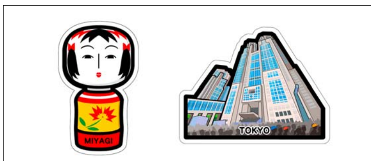
写真： 「全国都道府県・ご当地 フォルムカード 第4弾」 （左）縦タイプ／宮城県 （右）横タイプ／東京都

今回の「全国都道府県・ご当地フォルムカード」第4弾シリーズ（計 47 種）では、「宮城県／こけし」や「東京都／東京都庁舎」、季節感を盛り込んだ「奈良県／吉野山の桜」など各地のご当地を表現する新たなイラストをラインナップしました。2009 年 9 月発売の第1弾から今回で第4弾目となり、現在販売中の第1弾から第3弾シリーズとあわせて各地ごとに 4 種類（全 188 種類：富士山除く）となり、豊富なイラストバリエーションで幅広い年代層にお楽しみいただけます。